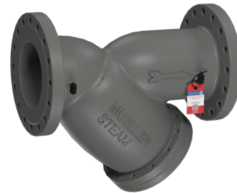
Modèle 752 SM