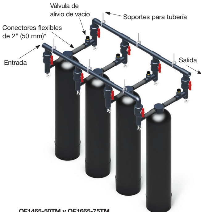
OF1465-50TM y OF1665-75TM