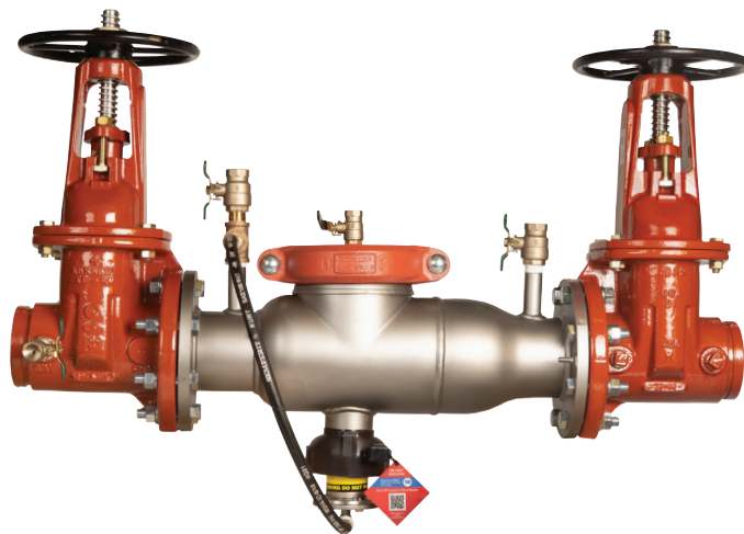
4000SS-OSY avec capteur d'inondation

Les spécifications des produits Incendies et aqueducs Ames en unités impériales et métriques sont approximatives et sont fournies à titre indicatif. Pour obtenir des mesures précises, veuillez contacter le service technique d'Incendies et aqueducs Ames. Incendies et aqueducs Ames se réserve le droit de changer ou de modifier la conception, la construction, les spécifications ou les matériaux des produits sans préavis ni obligation de procéder à ces changements et modifications sur les produits Incendies et aqueducs Ames vendus antérieurement ou ultérieurement.