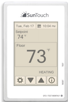
Pantalla de tema marrón claro

Wi-Fi para el acceso remoto, además del máximo nivel de comodidad, conveniencia y eficiencia.