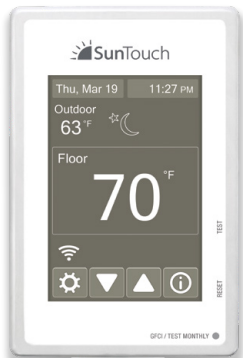
Pantalla de tema Espresso